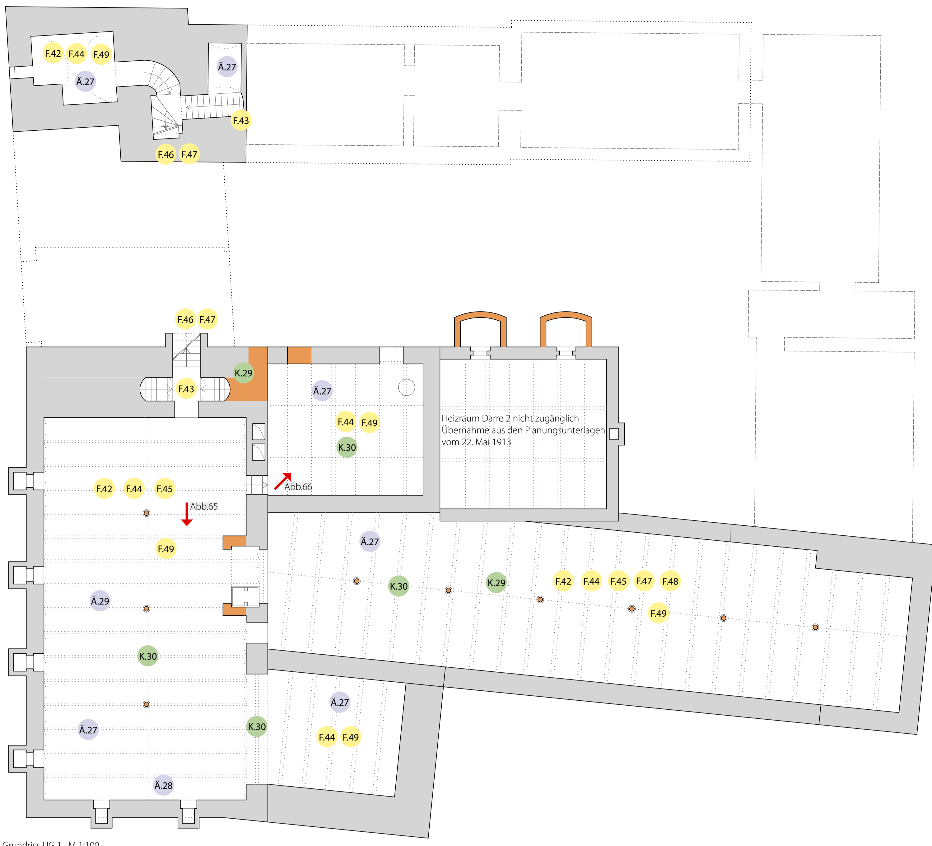
Grundriss UG 1 | M 1:100