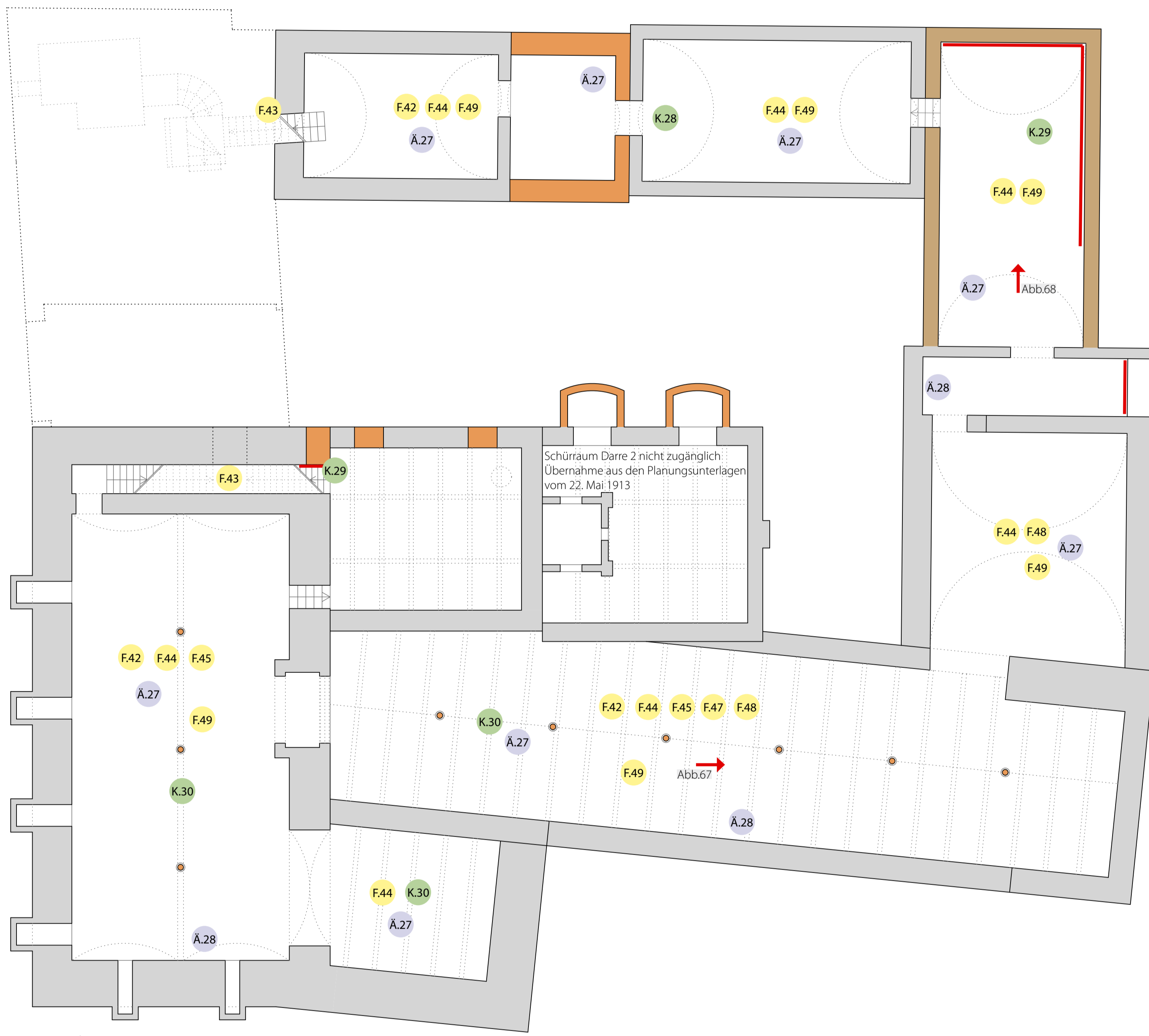
Grundriss UG 2 | M 1:100